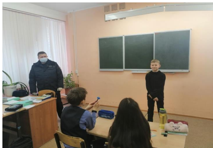
Материал подготовили волонтеры МБУ «Школа №28»