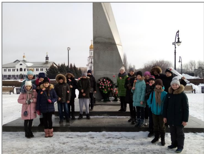
к Памятнику защитникам Отечества, погибшим при